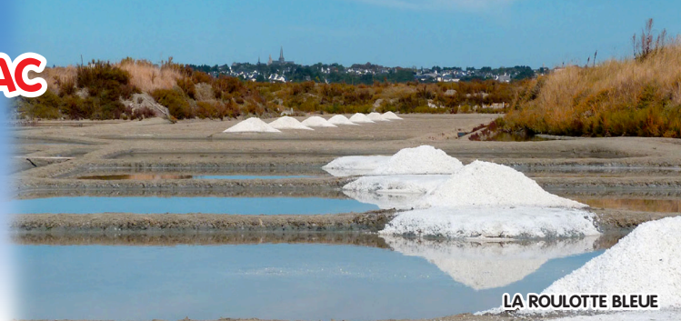
LA ROULOTTE BLEUE